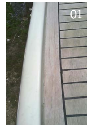
01,02 Une plateforme de bain avec et sans thermographie. La partie délamérée se voit bien sur la photo thermique (surface verte).

judiciaires, un suivi des travaux de construction ou de refit, ainsi que des certificats pour la haute mer. René Cellarius conseille également des assurances sur des questions concernant le développement de produits ainsi que des chantiers navals sur des questions spécifiques touchant aux assurances ainsi qu'aux processus de travail et de gestion.