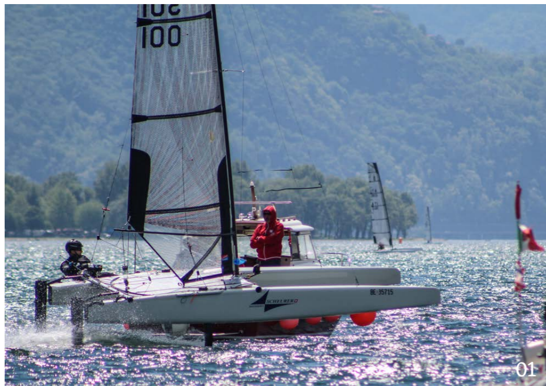
01 Un A-Cat du chantier Scheurer lors des championnats suisses 2017 à Maccagno, sur le lac Majeur.