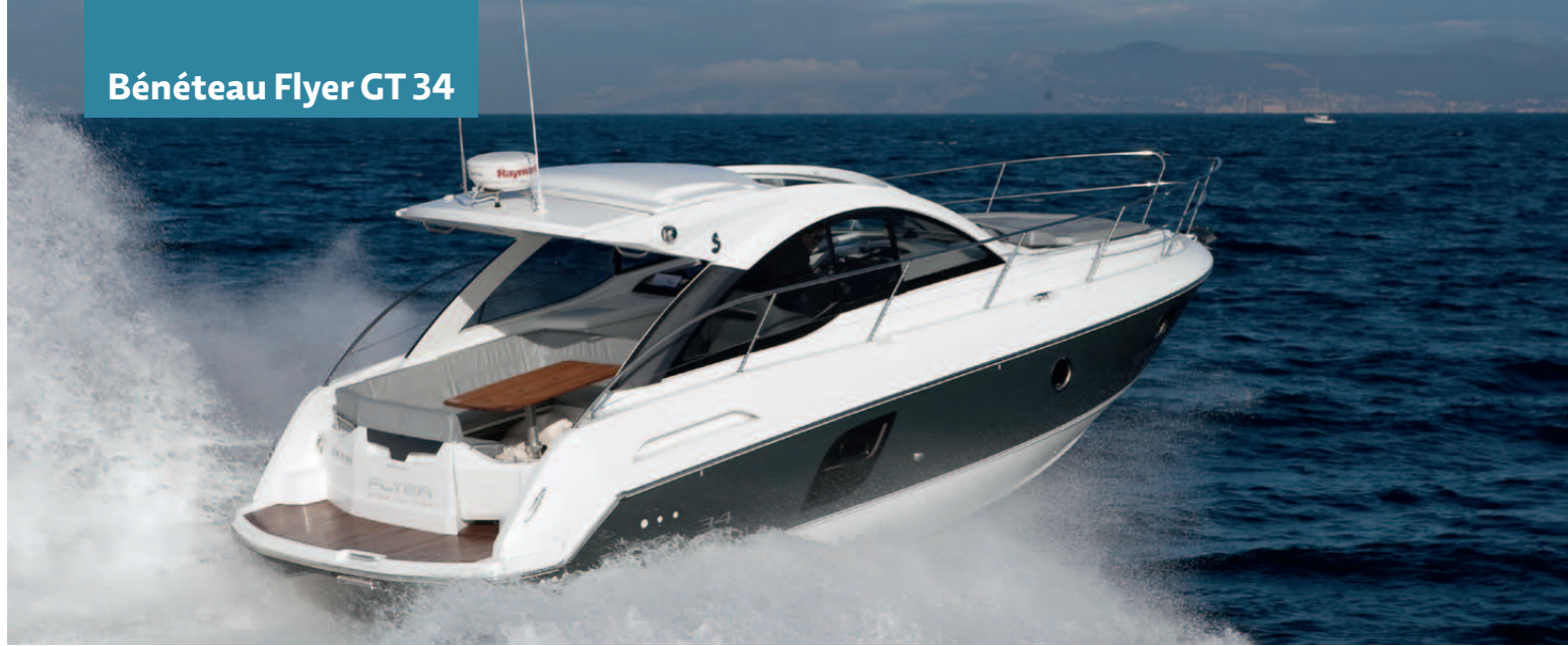
Bénéteau Flyer GT 34