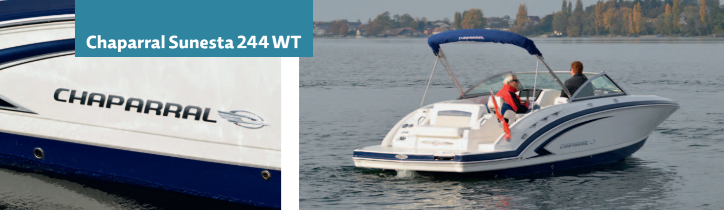
Chaparral Sunesta 244 WT