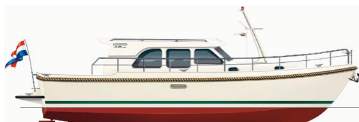
Linssen 40.9 Sedan