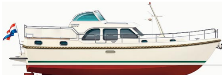
Linssen 40.9 AC