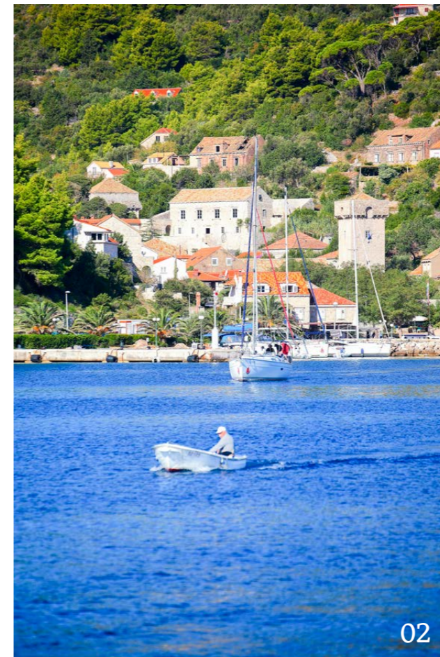
01 Les îles du sud de la Dalmatie sont idéales à découvrir à la voile! 02-04 Les derniers jours de navigation avec escales à Šipan, Lopud et Kolčep.

une pause café. Tout d'abord pour nous rendre à Podškolj, qui s'avère cependant trop exposée au nord-est et dont le fond rocheux ne provoque pas non plus l'enthousiasme de l'équipage. Saplunara offre quant à elle un bon abri contre le vent du nord nocturne. Cependant, là où les profondeurs de mouillage sont adéquates, la baie est densément peuplée par les bouées des restaurants. Nous acceptons donc l'inévitable et amarrons tout d'abord notre bateau à une bouée, puis réservons une table pour le souper dans le restaurant appartenant à cette dernière. La «Franca» propose de la cuisine sans fioritures, et le vin maison est vinifié sans trop de tannin. Les prix sont raisonnables, et ni la table ni la terrasse au clair de lune ne sont facturées en supplément. Nous terminons notre dernière journée de navigation par Šipan, Lopud et Kolčep. Ces îles sont si petites et si proches de Dubrovnik que de nombreux navigateurs les négligent. Elles constituent pourtant un microcosme qui, dans un espace très réduit, nous aurait offert tout ce que nous avons vécu en une semaine au fil de longues traversées. 🌊