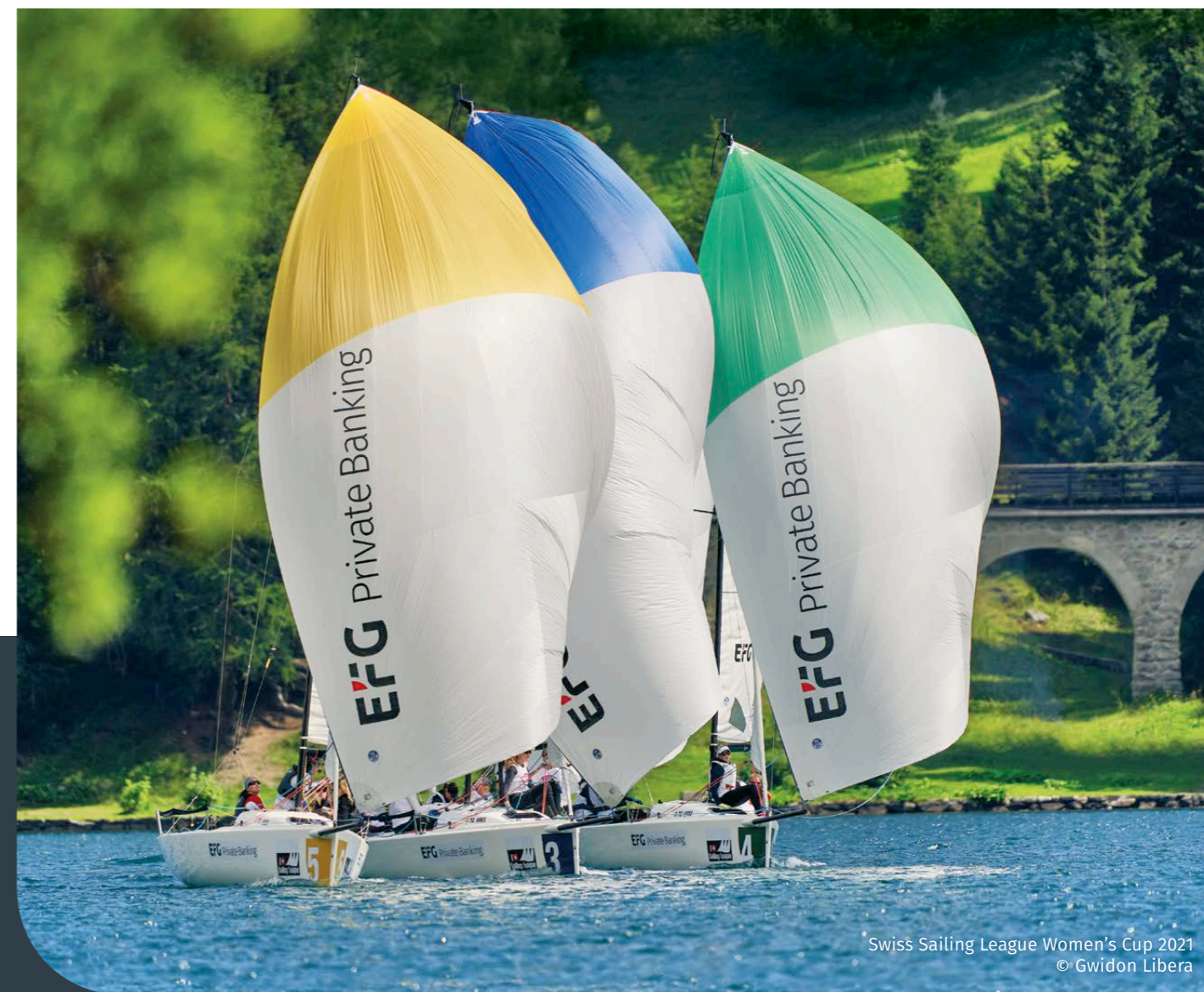
Swiss Sailing League Women's Cup 2021

L'un de ses voiliers classiques se trouve sur le lac de Zurich, un deuxième sur le lac de Morat, et le troisième se trouve actuellement encore chez un ami. Au moins 60 jours par an, le directeur de clinique et médecin-chef du service de néphrologie et d'hypertension se libère quelques heures pour aller naviguer sur le lac. «Étant donné que le vent n'est pas fiable sur le lac de Zurich, j'ai fini par acheter un bateau à moteur. J'ai trouvé