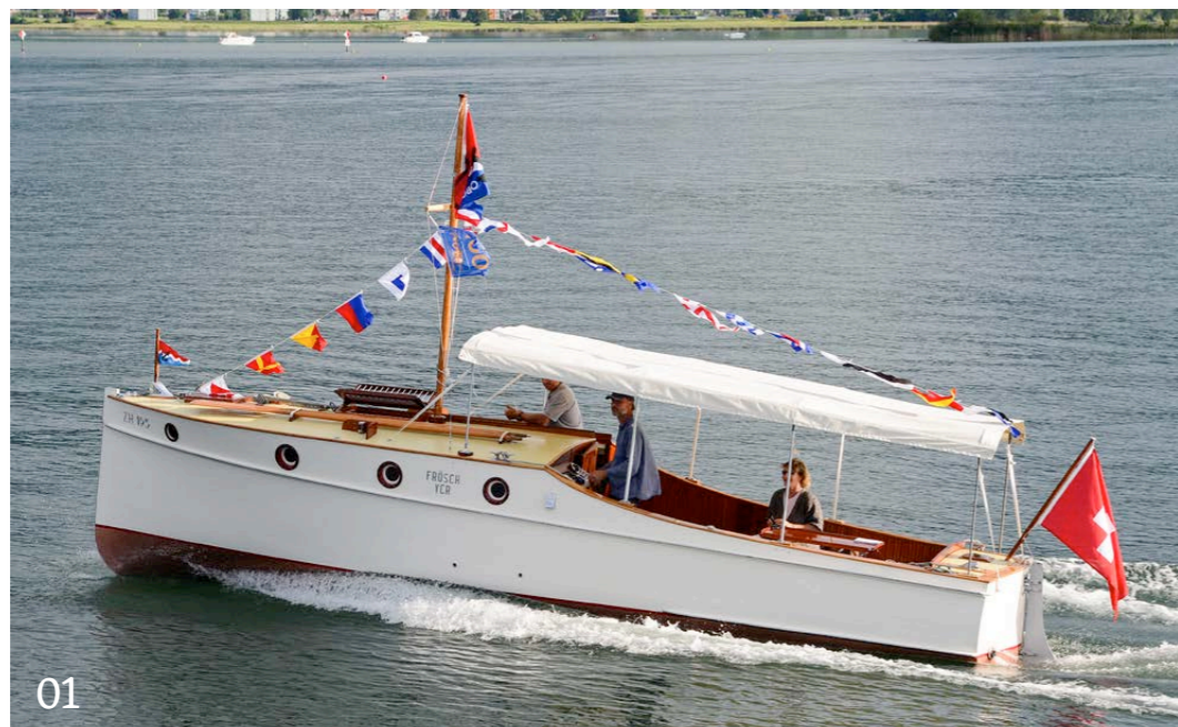
01-03 Photos de la dernière rencontre en 2014, qui a comblé le cœur de nombreux fans de oldtimer.