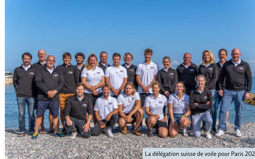
La délégation suisse de voile pour Paris 2024

à des milliers de spectateurs et spectatrices de suivre les compétitions de près. Sur le plan météorologique, le plan d'eau olympique est caractérisé par le mistral. Ce phénomène est dû à l'interaction entre un anticyclone stable au-dessus du golfe de Gascogne et une dépression sur le golfe de Gênes. Lorsqu'une perturbation se déplace vers l'est sur le nord de la France, de l'air polaire s'écoule dans la région méditerranéenne. Le mistral souffle généralement le plus fort en hiver et au printemps; il peut également se manifester en été, mais est généralement plus faible à cette