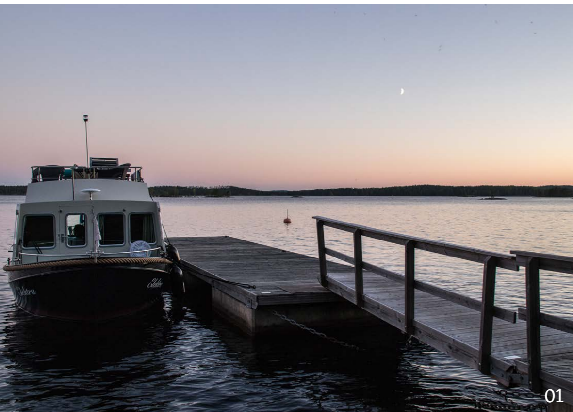
01 Mitternachtsstimmung in Finnland: Die hellen Nächte waren ein tolles Erlebnis.