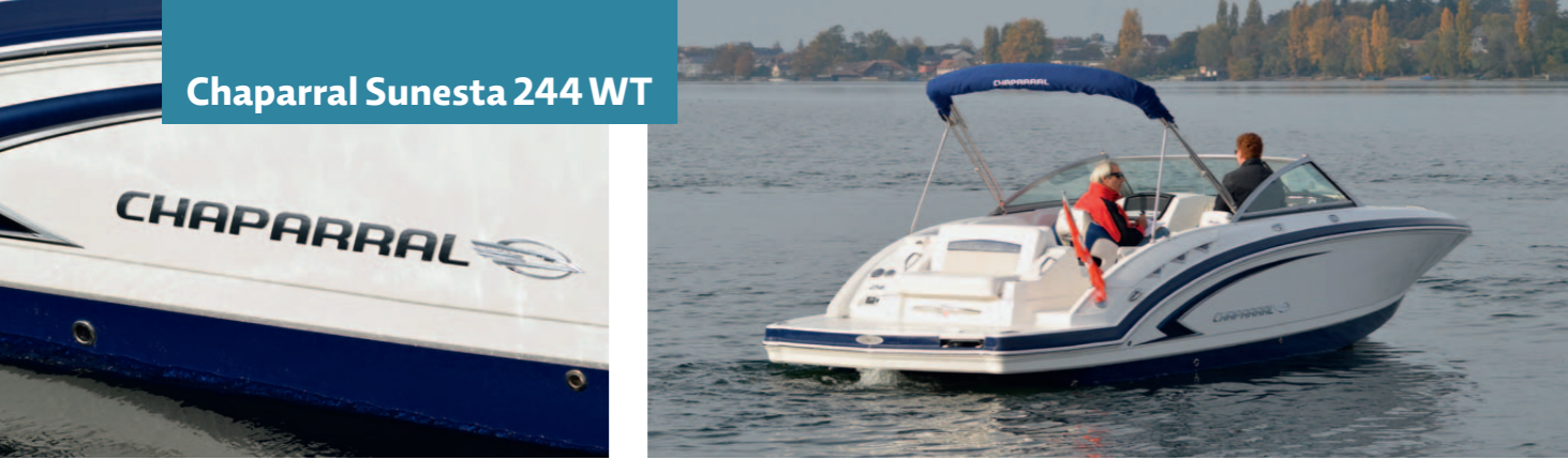
Chaparral Sunesta 244 WT