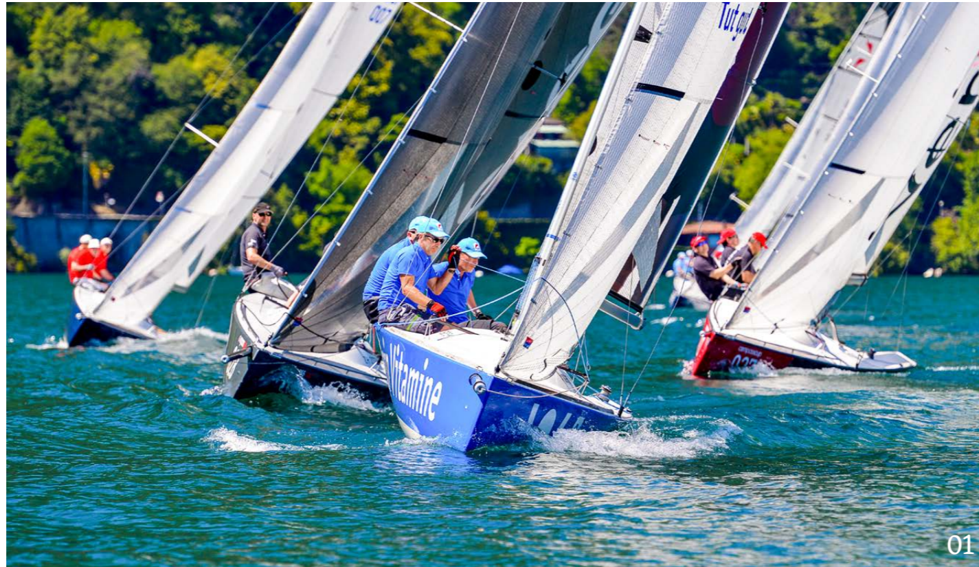
01-03 Der Act 4 in Ascona entschädigte für alle Entbehrungen der letzten Monate: Die Stimmung, das Wetter und das Segelerlebnis waren einmalig.

Act 4 und 5 des compasscup wurden im Juni «auf fremden Gewässern» ausgetragen: auf dem Lago Maggiore und auf dem Genfersee. Beide Acts gehören zu den Höhepunkten der Saison.