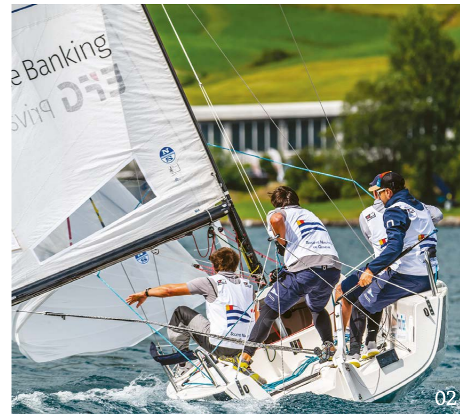
01-03 Endlich wieder Action auf den Regattabahnen der SSL.