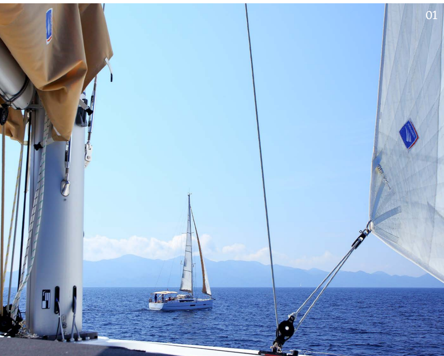
01 Unter Segel lässt sich die Süddalmatische Inselwelt genießen! 02-04 Die letzten Segeltage mit Halt in Šipán, Lopud und Kolčep.