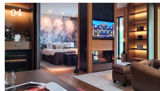
02-04 Stilvolles Interieur in The Chedi Residences.